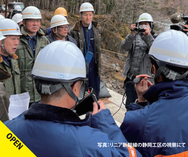
写真:リニア新幹線の静岡工区の視察にて