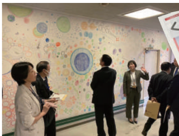
広島県教育委員会発行

不登校支援をはじめ、個別最適な学びの探究プログラムなどを実施し、オンラインと通学の両面から支援するという取り組みをしています。教科学習の指導だけでなく、テーマ学習や自らがイベントを企画・立案し、先生などのサポートだけでなく、民間のノウハウも相乗しながら実現していく事により、達成感だけでなく、心から感謝できる環境の醸成など、幅広く「成長」を促えています。