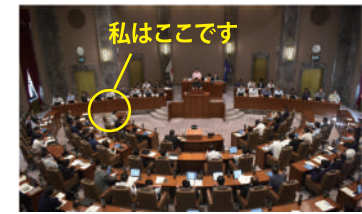
↓県議会本会議の様子