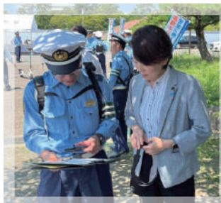
電動キックボードの試乗体験