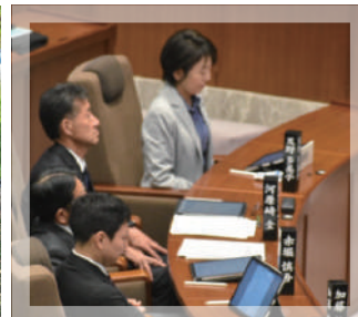
議場にて（県議会臨時会）